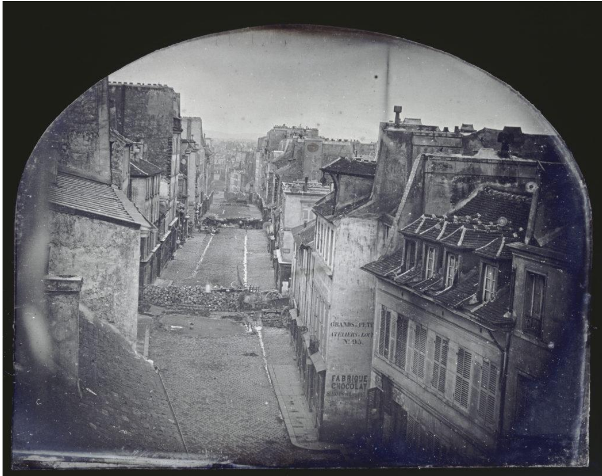
Thibault, La Barricade de la rue Saint-MaurPopincourt avant l'attaque par les troupes du général Lamoricière, le dimanche 25 juin 1848 Musée d'Orsay, Paris Photo © RMN-Grand Palais (musée d'Orsay) / Hervé Lewandowski. Disponível no catálogo online da exposição Soulevement .

Por fim, o desejo que é indestrutível, quando os levantes, manifestações, ocupações sobrevivem para além do seu desaparecimento. Pode-se acabar em lágrimas, em corpos mutilados, mas o desejo ainda permanecerá vivo, se não nesses que lutaram e resistiram, nos que virão logo a seguir. O desejo é o que mantém vivo, mantém os pequenos pontos luminosos no escuro da noite. Como a corajosa fotografia de um membro do Sonderkommando de Auschwitz-Birkenau que registrou os únicos testemunhos visuais da asfixia por meio de gás, e uma própria testemunha do perigo, de capturar o que acontecia em Birkenau.