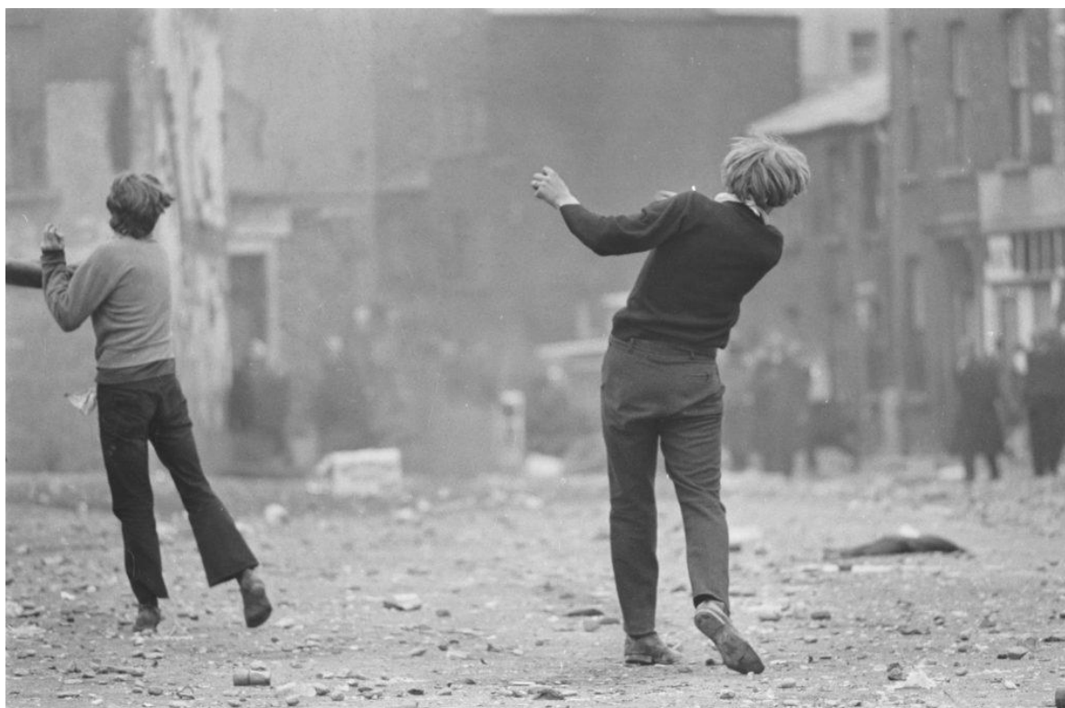
Gilles Caron. Manifestantes católicos, Batalla de Bogside, Derry, Irlanda del Norte, agosto 1969. ©Gilles Caron/Fondation Gilles Caron /Gamma Rapho. Disponível no catálogo online da exposição Soulevement .