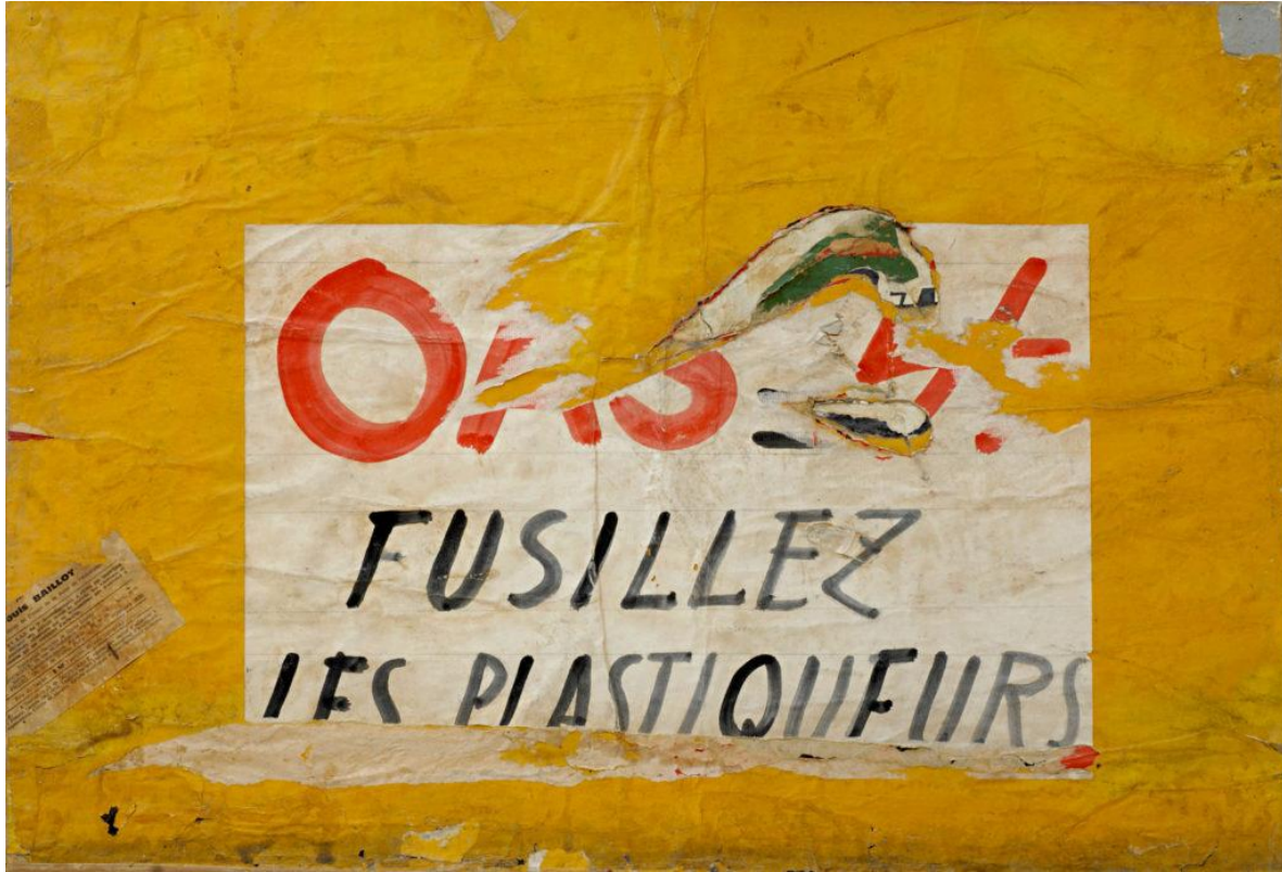
Raymond Hains, OAS. Fusillez les plastiqueurs, 1961 Collection particulière © ADAGP, Paris, 2016 / Photo: Michel Marcuzzi. Disponível no catálogo online da exposição Soulevement .

O terceiro gesto com o clamor da palavra, ou a palavra exclamada, quando o não se articula em palavras, em frases para contar, cantar, berrar, gritar, discutir, transmitir. Protestos que ganham vozes no panfleto, no lambe-lambe, nas redes sociais, como os cartazes de Raymond Hains nas ruas de Paris.