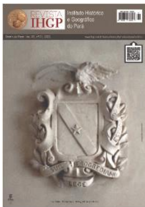
Imagem: Capa da Revista online do IHGP, novo layout.

A revista online do IHGP, do qualis B3 subiu para B1 com possibilidade de alcançar o extrato A da CAPES; está praticamente em todas as plataformas de nível médio do mundo, especialmente com pesquisadores em âmbito nacional e na América Latina, conseguindo atualizar a periodicidade em 2 edições anuais desde 2017.