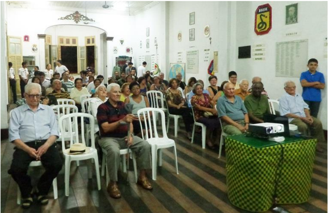
Reunião de Ex-combatentes e familiares no Salão Nobre da AECB-PA em janeiro de 2013.

Porém, como haviam feito no duríssimo frio italiano, sob condições de combate extremamente adversas, eles resistiram, se organizaram, criaram as Associações de Ex-Combatentes, como a AECB-RJ, a primeira, ainda em 1945, e a AECB-PA (1946), e iniciaram uma nova batalha “morro acima”, como em Monte Castelo, desta vez em solo pátrio, pelo reconhecimento de seus direitos e sua história. Grande parte dessas histórias de vida e luta só começaram a vir à tona muitas décadas após o fim da campanha da FEB.