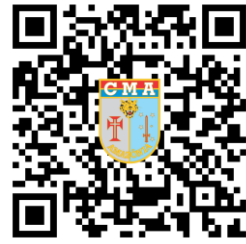
Imagem. Detalhe da página no Portal do CMA e layout da placa de aço inox doada ao CMA

A publicação da Relação de Pracinhas da Amazônia no Portal do CMA ensejou também a doação de nova placa de aço (90 cm x 60 cm), esta destinada ao Q.G. do Comando Militar da Amazônia, com descerramento previsto para ocorrer durante as celebrações do 77º Dia da Vitória (8 de Maio de 1945) em 8 de Maio de 2022.