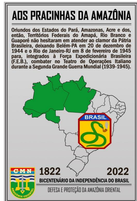
Layout de placa de aço inox alusiva aos Pracinhas da Amazônia no Bicentenário da Independência para o CMN